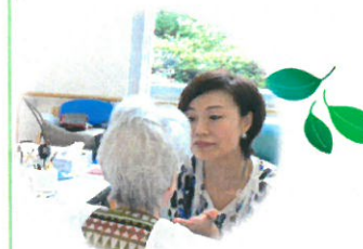
メイクのボランティアさん

お祭り、敬老会、クリスマス会、地域小学校との交流会などの行事が季節ごとに行われます。また地域の方々やボランティアの皆様にご協力いただき、書道教室、紙芝居、合唱、ハーモニカ演奏など年間を通じて地域との交流も盛んです。