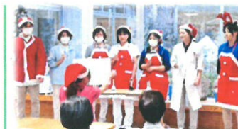
クリスマス 職員による出し物