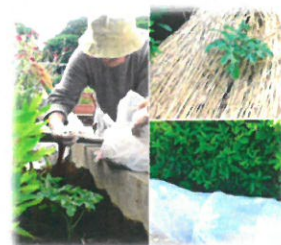
すいかの栽培中です。

リハビリ専門スタッフ（理学療法士、作業療法士）による身体機能の維持向上を実施し各人が心身共に自立した生活が送れるようにご支援いたします。4階の屋上ではすいか、とまと、きゅうりなどのミニ菜園で野菜を作っています。