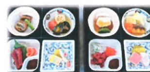
お正月料理。右がソフト食です。

お食事は楽しみの一つです。季節に合わせたお食事、月に一度の郷土食、世界の料理、ご利用者様と一緒に作る手作りおやつなど趣向をこらしております。またご状態にあわせてソフト食など、形状を変えてご用意させていただきます。